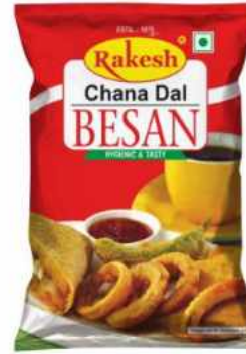
250 ग्राम (पाउच) | 500 ग्राम (पाउच) 1 कि.ग्राम (पाउच) | 5 कि.ग्राम | 35 कि.ग्राम