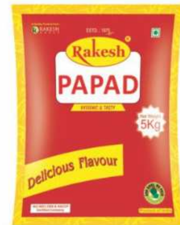
5 किलोग्राम (फिन्ना, ट्राईएंगल)