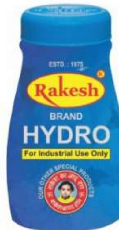
50 ग्राम | 100 ग्राम | 500 ग्राम