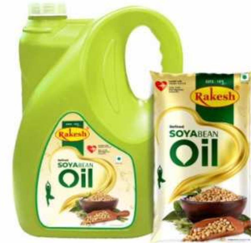
1 Ltr. | 500 ml, (पाउच) | 5 Ltr. (जार)