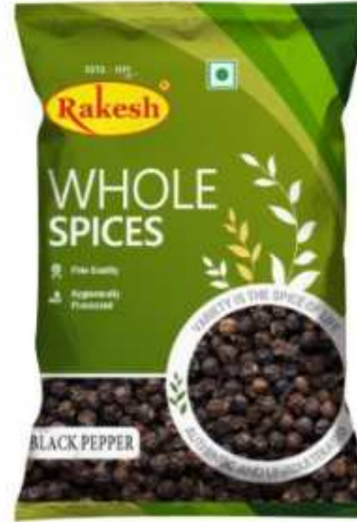
100 ग्राम (पाउच) | 50 ग्राम (पाउच)