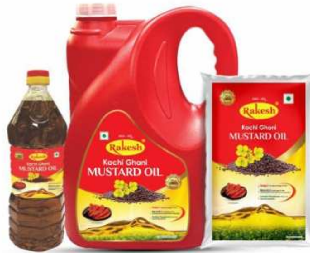
1 Ltr. | 500 ml | 200 ml (पेट बोतल) | 1 Ltr. | 500 ml, (पाउच) 5 Ltr. (जार)