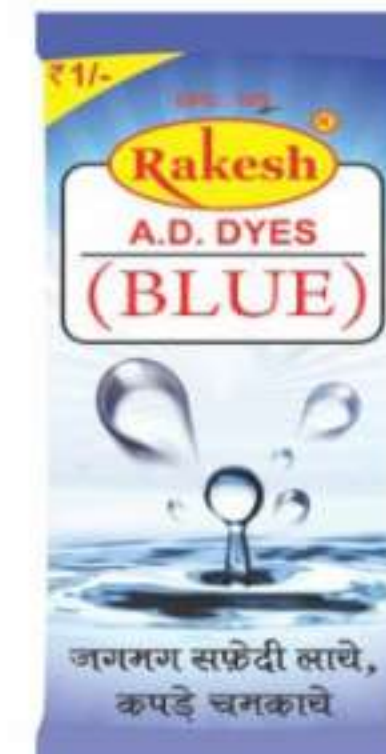
1 रुपये निल