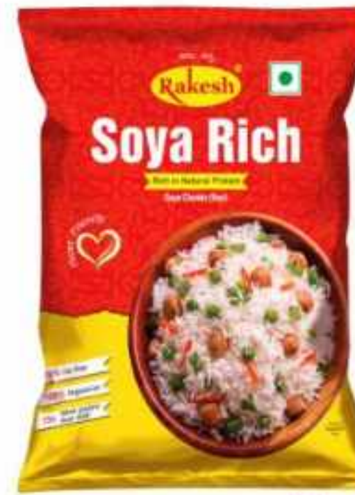
45 ग्राम (पाउच) | 200 ग्राम (फॅन्सी) 1 कि.ग्राम (पाउच) | 20 कि.ग्राम