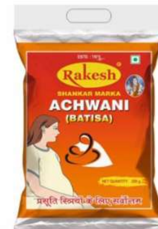
200 ग्राम | 400 ग्राम