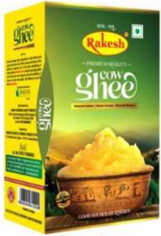
200 मि.ली. (डिब्बा) 500 मि.ली. (डिब्बा), 900 मि.ली. (डिब्बा)