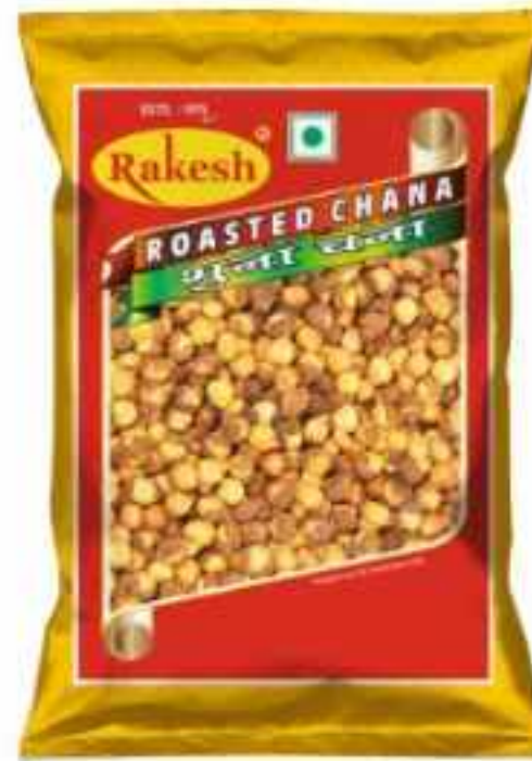
250 ग्राम (पाउच) | 10 कि.ग्राम 30 कि.ग्राम