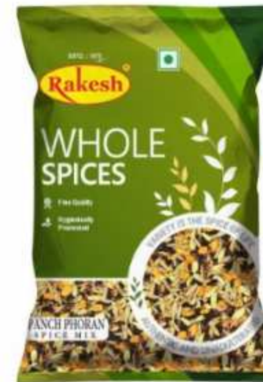
100 ग्राम (पाउच)