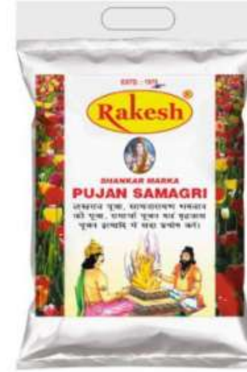
छोटा | बड़ा