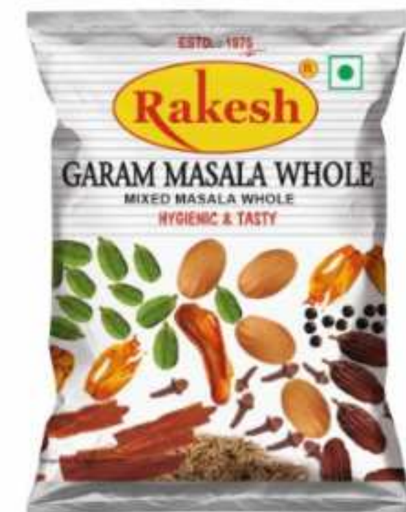
4 ग्राम (पाउच) | 12 ग्राम (पाउच) 50 ग्राम (पाउच)