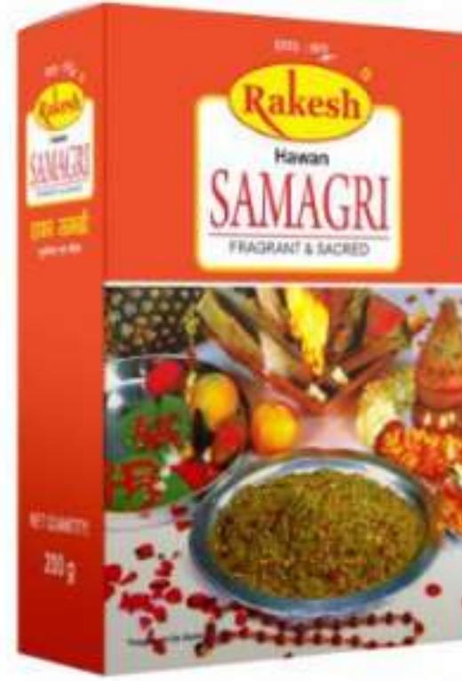
100 ग्राम (फैन्सी) | 200 ग्राम (फैन्सी)