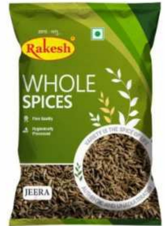
100 ग्राम (पाउच)