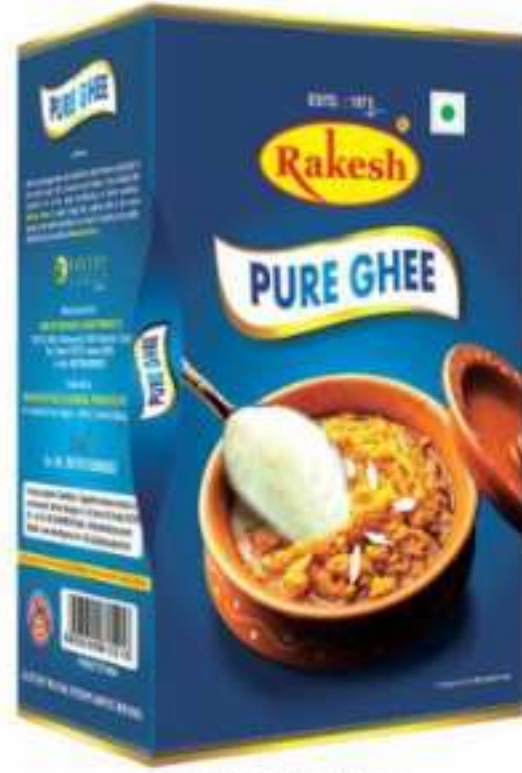
200 मि.ली. (डिब्बा) 500 मि.ली. (डिब्बा), 900 मि.ली. (डिब्बा)