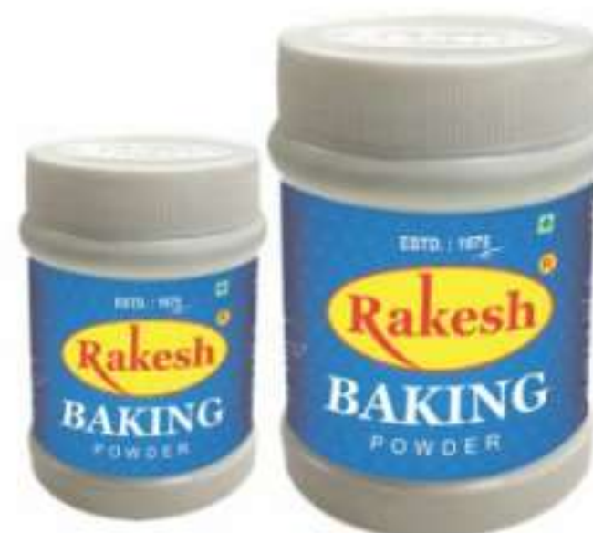
100 ग्राम, 500 ग्राम