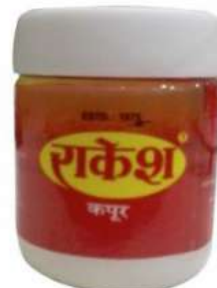
5 रु, 35 ग्राम 500 ग्राम (पाउच)