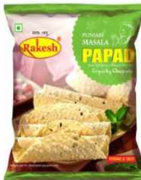
200 ग्राम (पाउच)