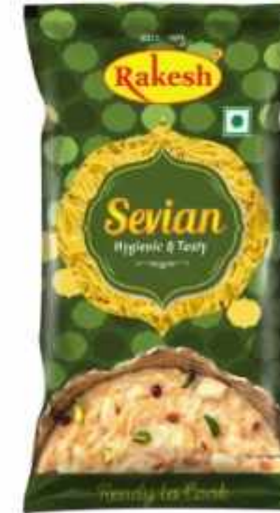
75 ग्राम (पाउच) 160 ग्राम (पाउच)