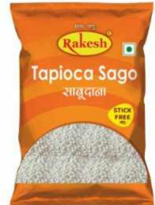
200 ग्राम (M), 200 ग्राम (S) 500 ग्राम (M), 500 ग्राम (S)