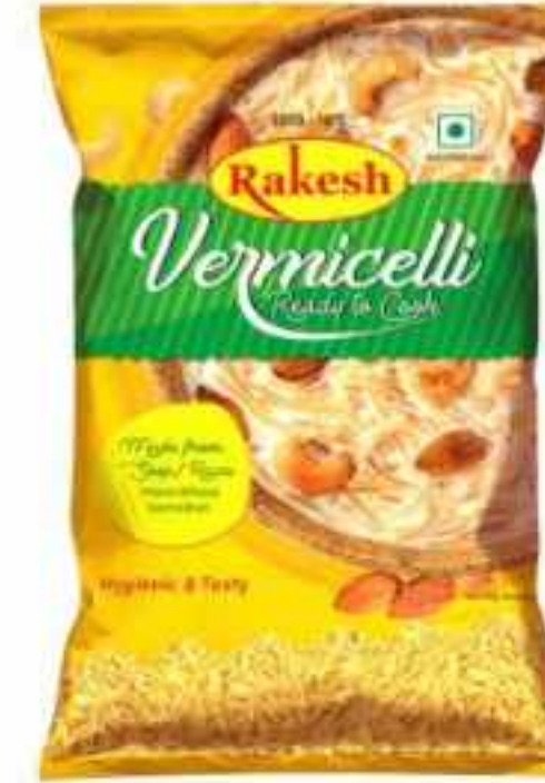
10 रुपये | 500 ग्राम (पाउच) 500 ग्राम रोस्टेड (पाउच)