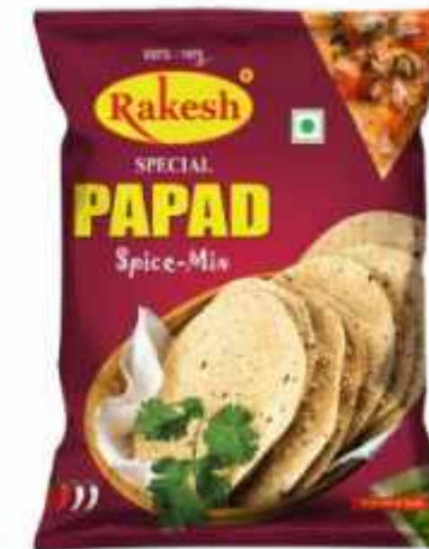
200 ग्राम (पाउच)