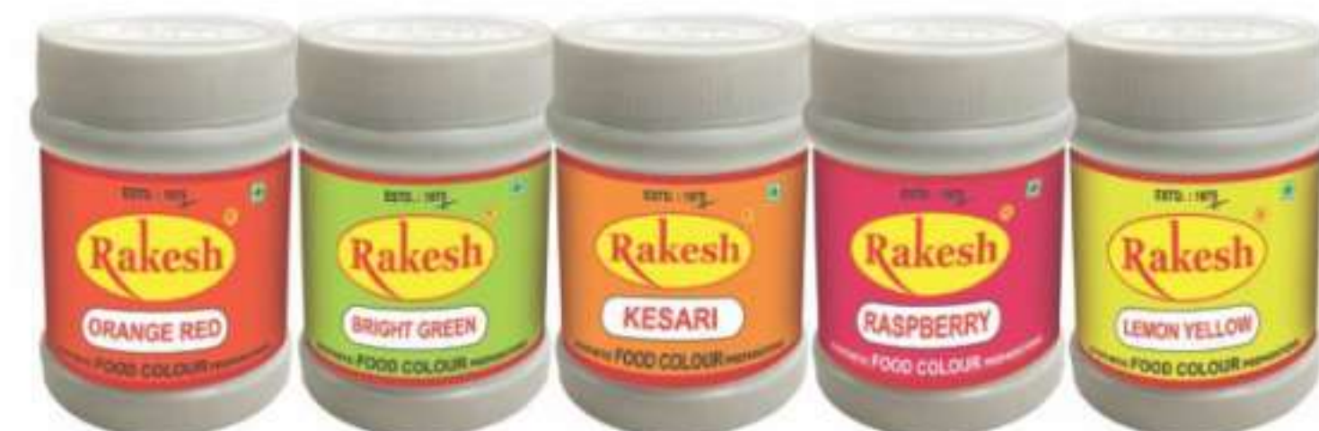
10 ग्राम, 100 ग्राम