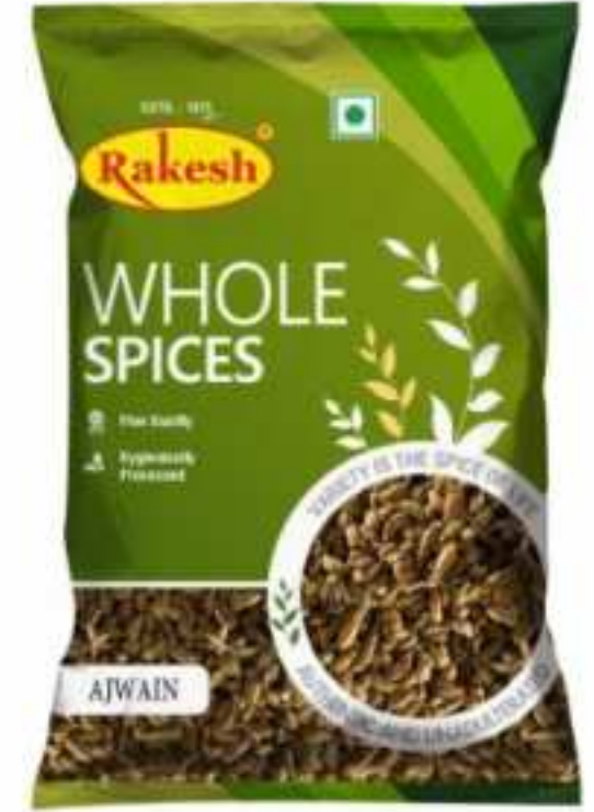
100 ग्राम (पाउच)