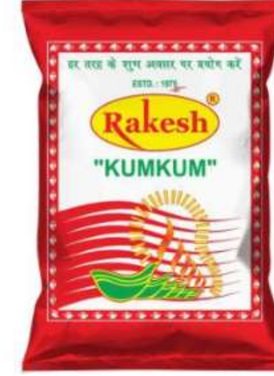
2 रुपये (पाउच) | 5 रुपये (पाउच) 500 ग्राम (पाउच) |