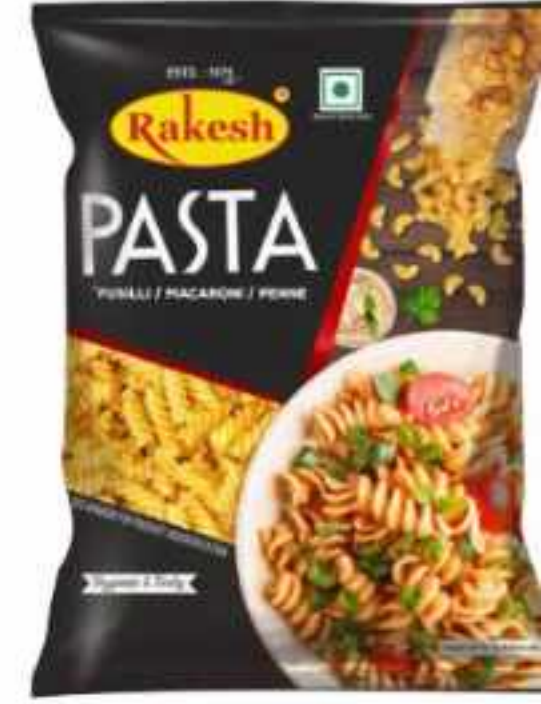
75 ग्राम (पाउच) | 500 ग्राम (पाउच) 5 कि.ग्राम | 20 कि.ग्राम