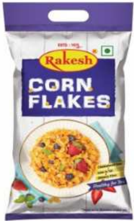
200 ग्राम, 500 ग्राम