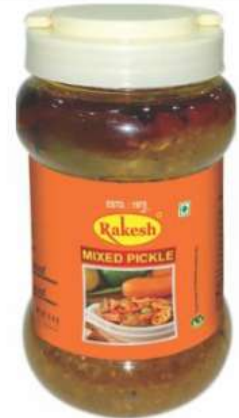
1 किलो (जार), 5 किलो (जम्बो जार)