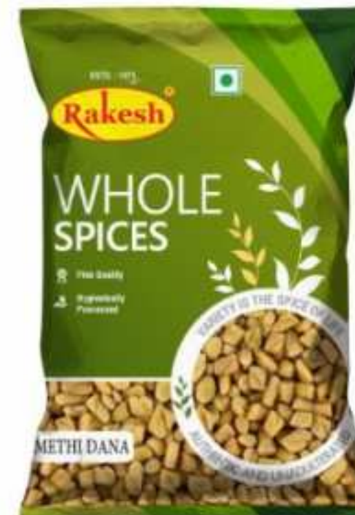
100 ग्राम (पाउच)