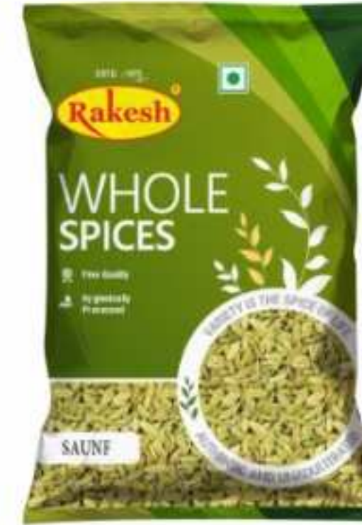
100 ग्राम (पाउच)