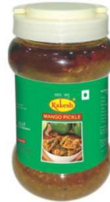
1 किलो (जार), 5 किलो (जम्बो जार)