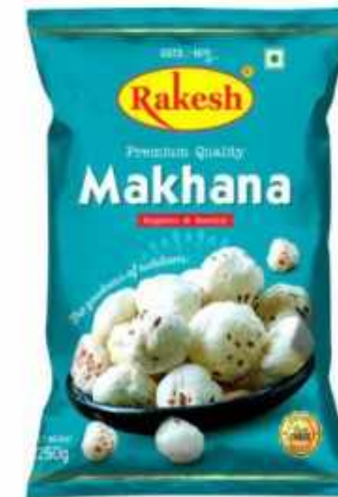
250 ग्राम (पाउच)