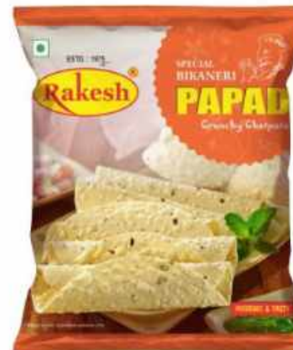
200 ग्राम (पाउच)