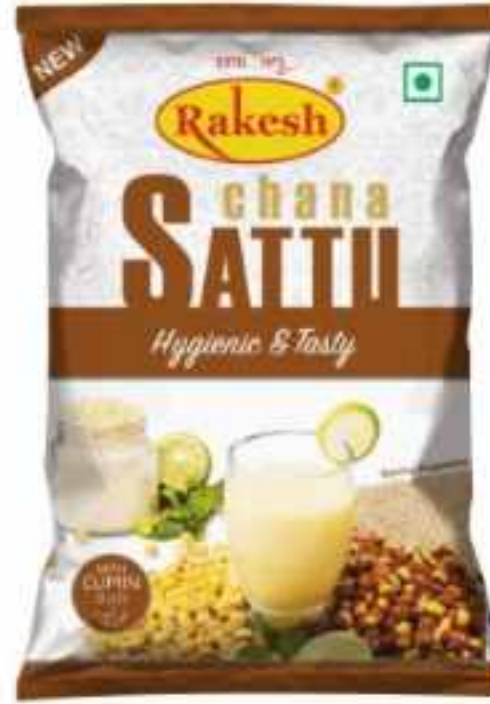
60 ग्राम (पाउच) | 200 ग्राम (पाउच) 500 ग्राम (पाउच)