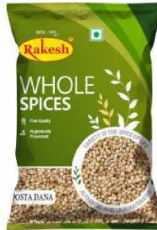
100 ग्राम (पाउच) | 50 ग्राम (पाउच)