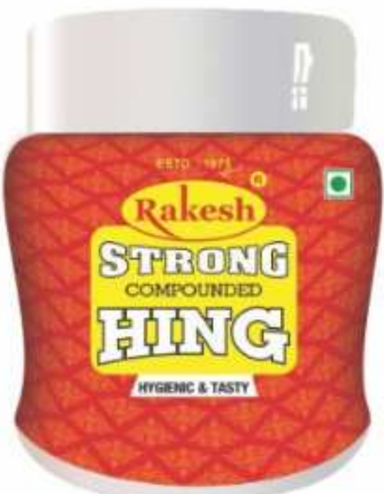
10 ग्राम | 25 ग्राम | 50 ग्राम