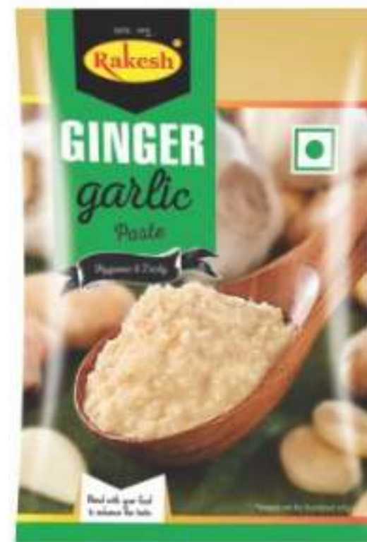
25 ग्राम (पाउच)